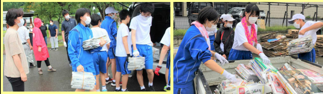
【校外指導部事業 リサイクル活動】