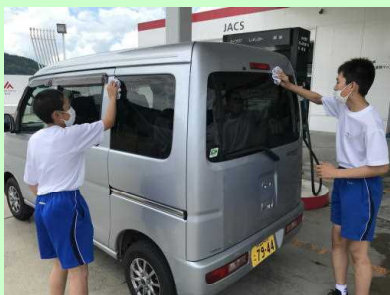
J A 仙人 S S