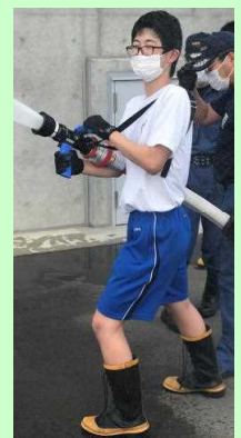
湯沢雄勝広域市町村圏組合消防署