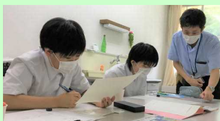
東成瀬村役場企画課