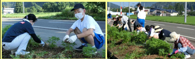
【文化体育研修部事業 キバナコスモス除草活動】

☆ 保護者の皆様、PTAキバナコスモス除草活動(7/25)、PTAリサイクル活動(8/22)へのご参加・ご協力ありがとうございました。